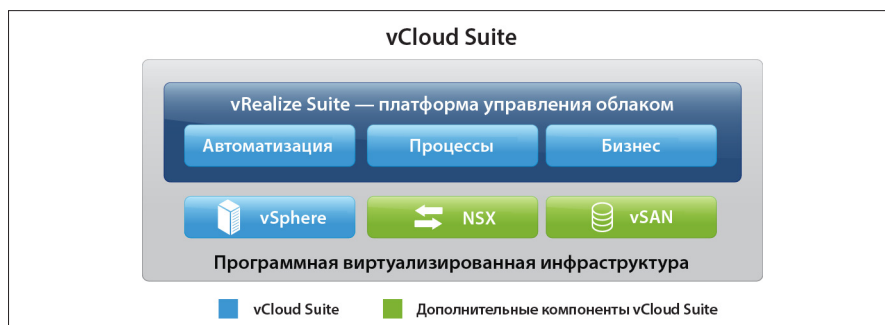
Рис. 1. Интегрированные продукты vCloud Suite

Продукты VMware vRealize по управлению облаком также полностью интегрированы с решениями программного ЦОД VMware, такими как VMware vSphere, VMware NSX® и VMware vSAN™. Структурные компоненты NSX, например виртуальные маршрутизаторы, средства балансировки нагрузки и брандмауэры, можно встроить в шаблон службы (схему), который создается в vRealize Automation, после чего их можно инициализировать и изменять по требованию в контексте выполняемого приложения в зависимости от потребностей бизнеса.