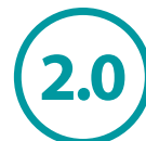
Рутокен ЭЦП 2.0

Сотни удостоверяющих центров, расположенных на всей территории Российской Федерации, используют решения Рутокен в качестве защищенного носителя ключа электронной подписи и цифрового сертификата.